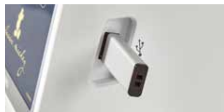
Porta USB attiva