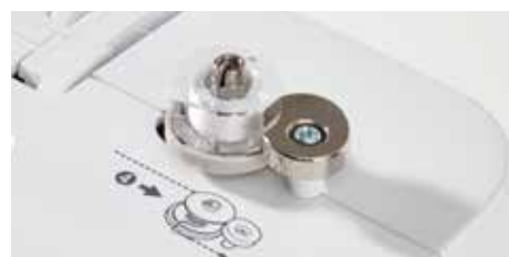
Sistema di avvolgimento bobina