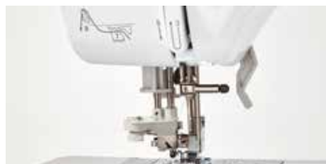
Sistema avanzato di infilatura dell'ago

Ecco solo alcune delle pratiche funzioni: