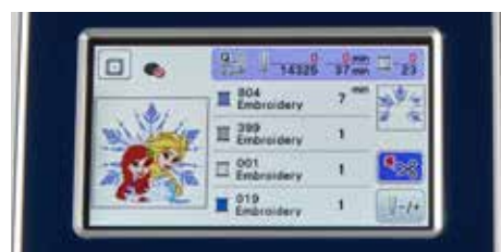
Schermo a sfioramento LCD a colori