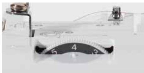
Tensione regolabile del filo