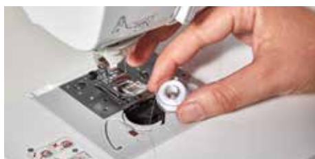
Inserimento della bobina