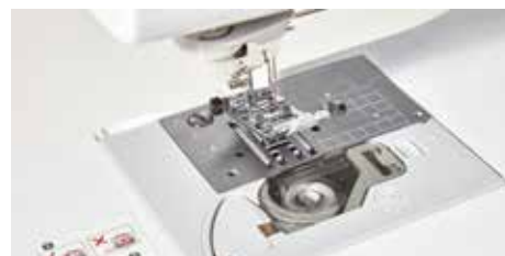
Trasporto a sette ranghi