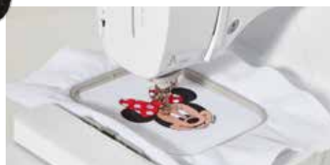
Area di ricamo 100 x 100 mm