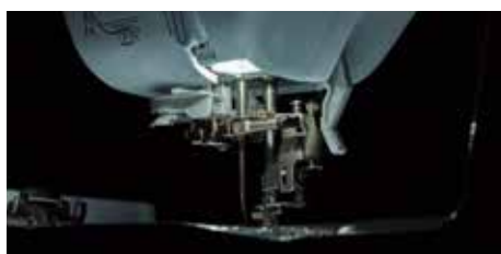
Luce LED super luminosa